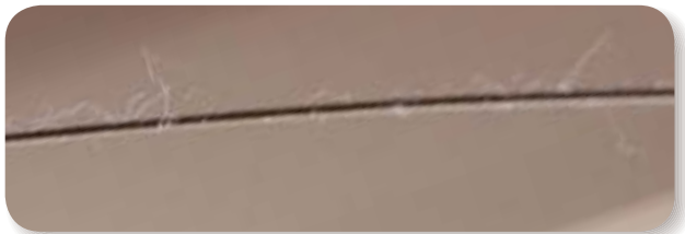
ガイドワイヤーに付着した コットンガーゼの繊維