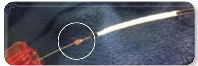
ガイドワイヤーをつたって、からまって しまったコットンガーゼの繊維